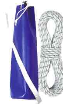
Sac pour commande