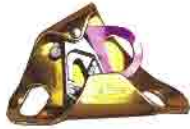
Bloqueur d'ascension CROLL