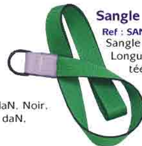
Sangle de sauvetage