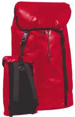
Sac de portage

Pour Lot Echelle. Mêmes caractéristiques que le sac jaune. Coloris bleu. Ø 36 cm. Hauteur : 60 cm. Volume : 60 litres.